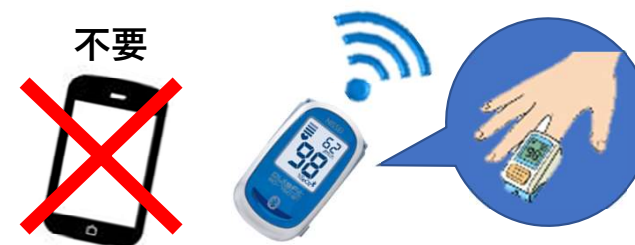
スマートフォン（例）パルスオキシメーター

お手元に届いたバイタル医療機器は、普段家庭用として使っているものと同じ使い方です。測定後は、主治医のパソコンへ数秒で自動転送されるため面倒な操作や、またスマートフォンは不要です。