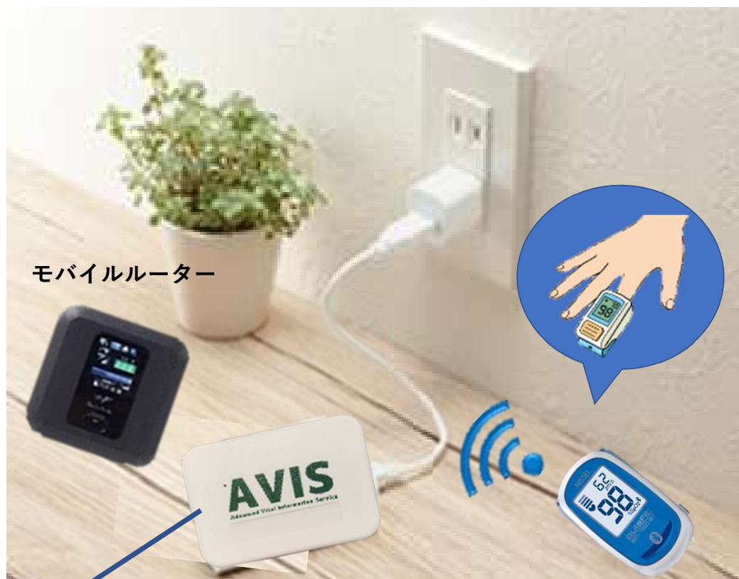
モバイルルーター